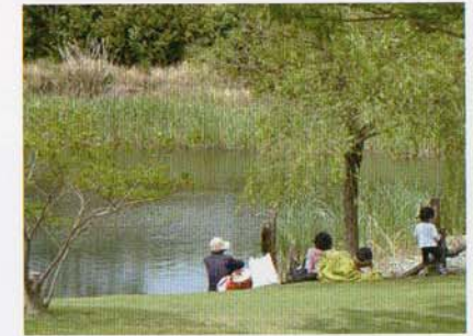
ピオトープ池&野の花の小径

番号は、現在位置を示すもので、現地の杭の番号と照合すると自分がいる位置がわかります。