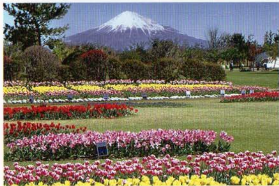
芝生広場B(チューリップ植栽地)